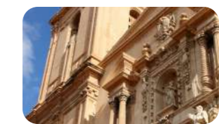
Basílica de Santa María.