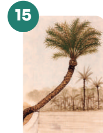
LA TOMBÀ DEL MUR

Latitud: 38°15'38.2"N Longitud: 0°41'33.2"W