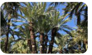
Jardín Huerto del Cura.