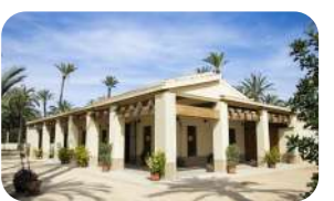
Casa-Museo del Hort dels Pontos.