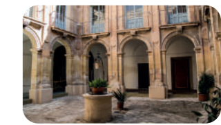
Centro Cultural Las Clarisas.