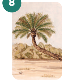
LA PIPA DE SAN PLÁCIDO

Latitud: 38°16'01.5"N Longitud: 0°41'45.9"W