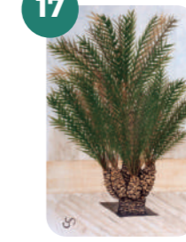
LA PALMERA TALEB RIFAI

Latitud: 38°15'42.5"N Longitud: 0°41'40.9"W