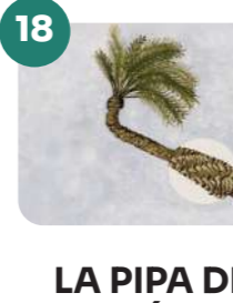
LA PIPA DE TRAVALÓN BAJO

Latitud: 38°15'46.2"N Longitud: 0°41'43.9"W