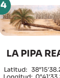
LA PIPA REAL

Latitud: 38°15'41.3"N Longitud: 0°41'27.3"W