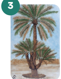
LA PALMERA DE DON DIEGO

Latitud: 38°16'11.7"N Longitud: 0°41'52.9"W