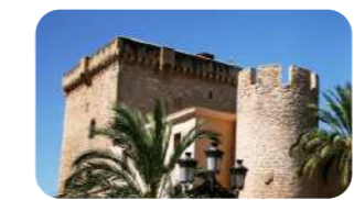
MAHE, Museo Arqueológico y de Historia de Elche.