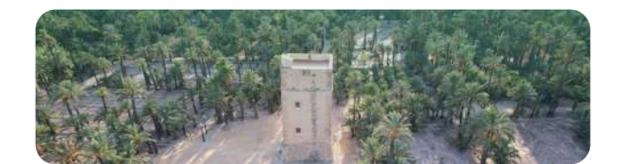
Torre dels Vaïllos