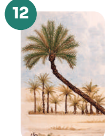
LA PIPA DE SEMPERE

Latitud: 38°15'48.0"N Longitud: 0°41'20.7"W