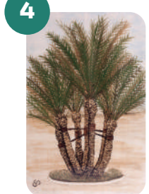
LA PALMERA DE LA FONT

Latitud: 38°16'11.5"N Longitud: 0°41'54.5"W