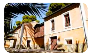
Museo del Palmaral, situado en el huerto de San Plácido.