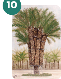
LA PALMERA IMPERIAL

Latitud: 38°15'45.2"N Longitud: 0°41'32.2"W